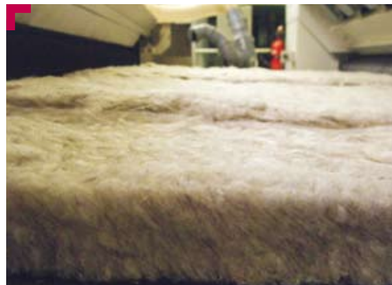
Matelas de fibres avant hydroliage

Pour arriver à la qualité de Flaxline , il est facile d'imaginer au combien le procédé de fabrication est délicat : on aère ces étoupes et on y adjoint la quantité strictement nécessaire de fibres de polyéthylène recyclé, permettant d'augmenter la souplesse du produit.