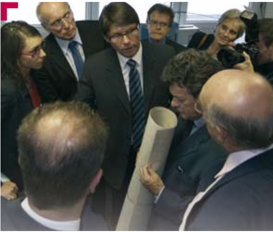
Du prototype présenté à Jean-Louis Borloo Ministre d'Etat de l'Ecologie, de l'Energie, du Développement Durable et de l'Aménagement du Territoire...