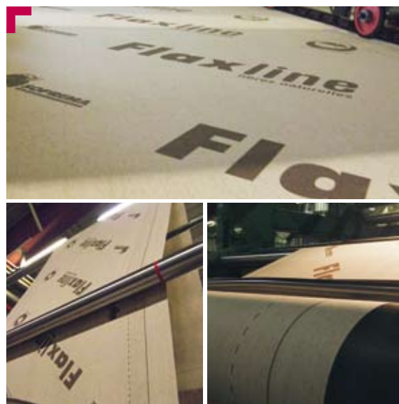
Un processus de fabrication dédié

Pressé pour évacuer l'excédent d'eau, Flaxline est dans un deuxième temps trempé dans une solution hydrophobe, telle que celle utilisée pour certains vêtements reconnus pour allier respirabilité et imperméabilité.