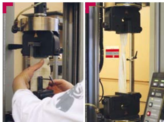
Flaxline a passé avec succès tous les tests de résistance en laboratoire : il présente une résistance à la déchirure au clou et à la traction exceptionnelle