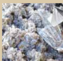
Ouate de cellulose